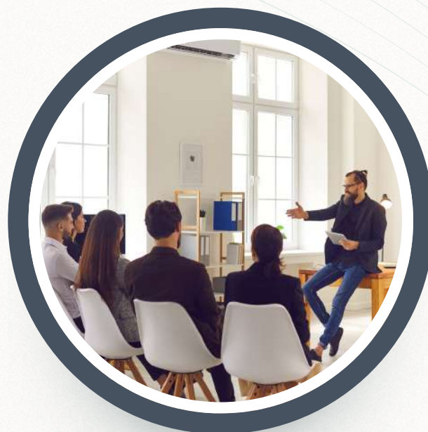
05. Capacitación, Jornadas de Consultoría, Webinars y Talleres