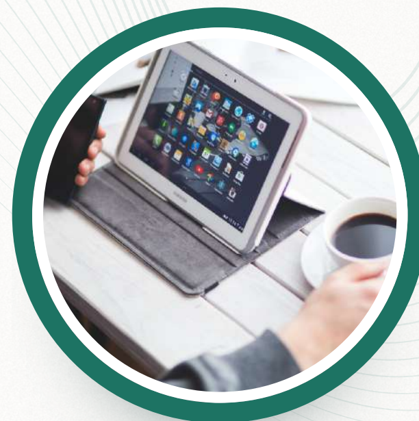
06. Plataforma de cursos en línea "Mi campus"