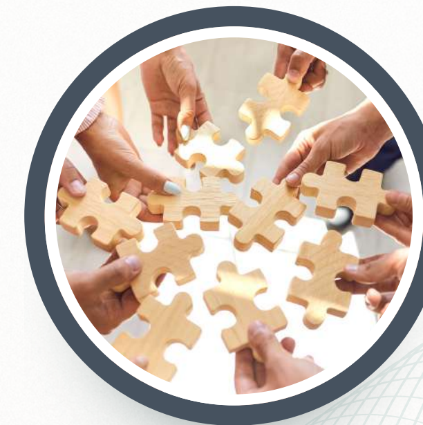
04. Registro SIEM