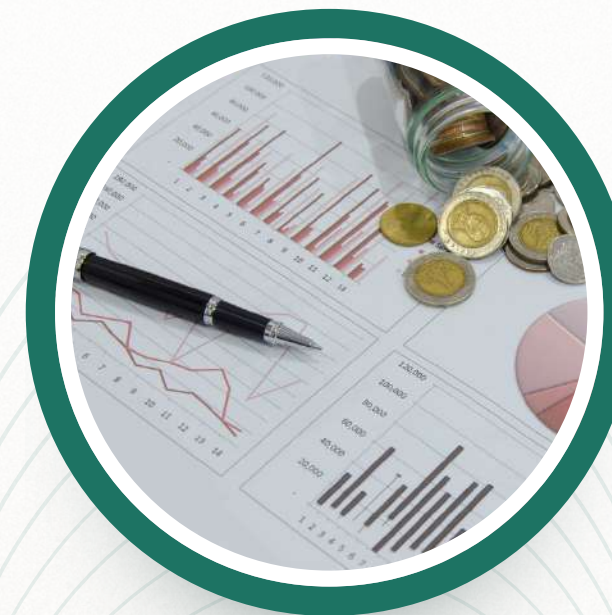
03. Estudio de Mercado