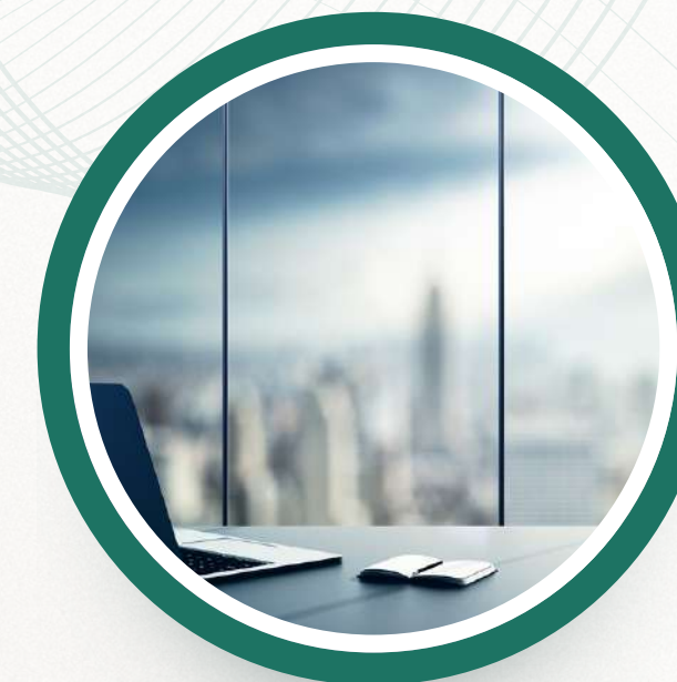
08. Renta de oficinas